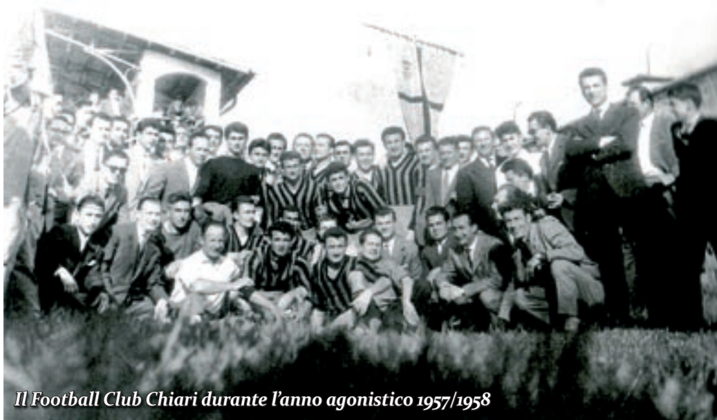
Il Football Club Chiari durante l'anno agonistico 1957/1958