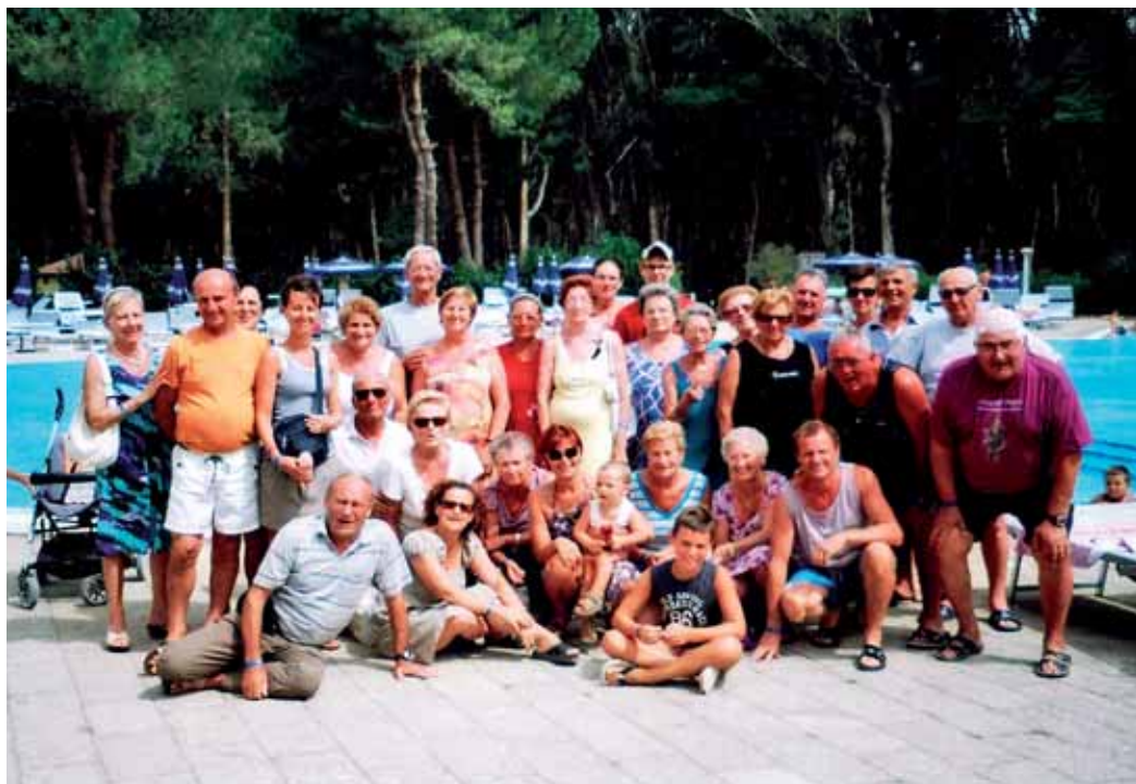
Un saluto per i lettori dell'Angelo da parte un bel gruppo di amici clarensi e non solo. La scorsa estate hanno vissuto una bella vacanza a Marina di Pisticci, località turistica sulla costa ionica della Basilicata, in provincia di Matera.

A questo punto mi sono sorte alcune curiosità che credo siano anche quelle dei lettori: al giorno d'oggi, alla fine del 2011 e a oltre un secolo di distanza da quel 1887, sono ancora attuali queste regole di comportamento? Oppure sono cambiate con i tempi? Il sodalizio svolge ancora gli stessi compiti o ha differenziato la sua attività? Il numero di aderenti è cambiato negli anni? Come manifesta la sua presenza il sodalizio nella Chiari del 2011? Come riesce a mantenere fede alle sue origini? Incontrerei volentieri le Consorelle del Santissimo Sacramento per un'intervista da pubblicare nei prossimi mesi. □