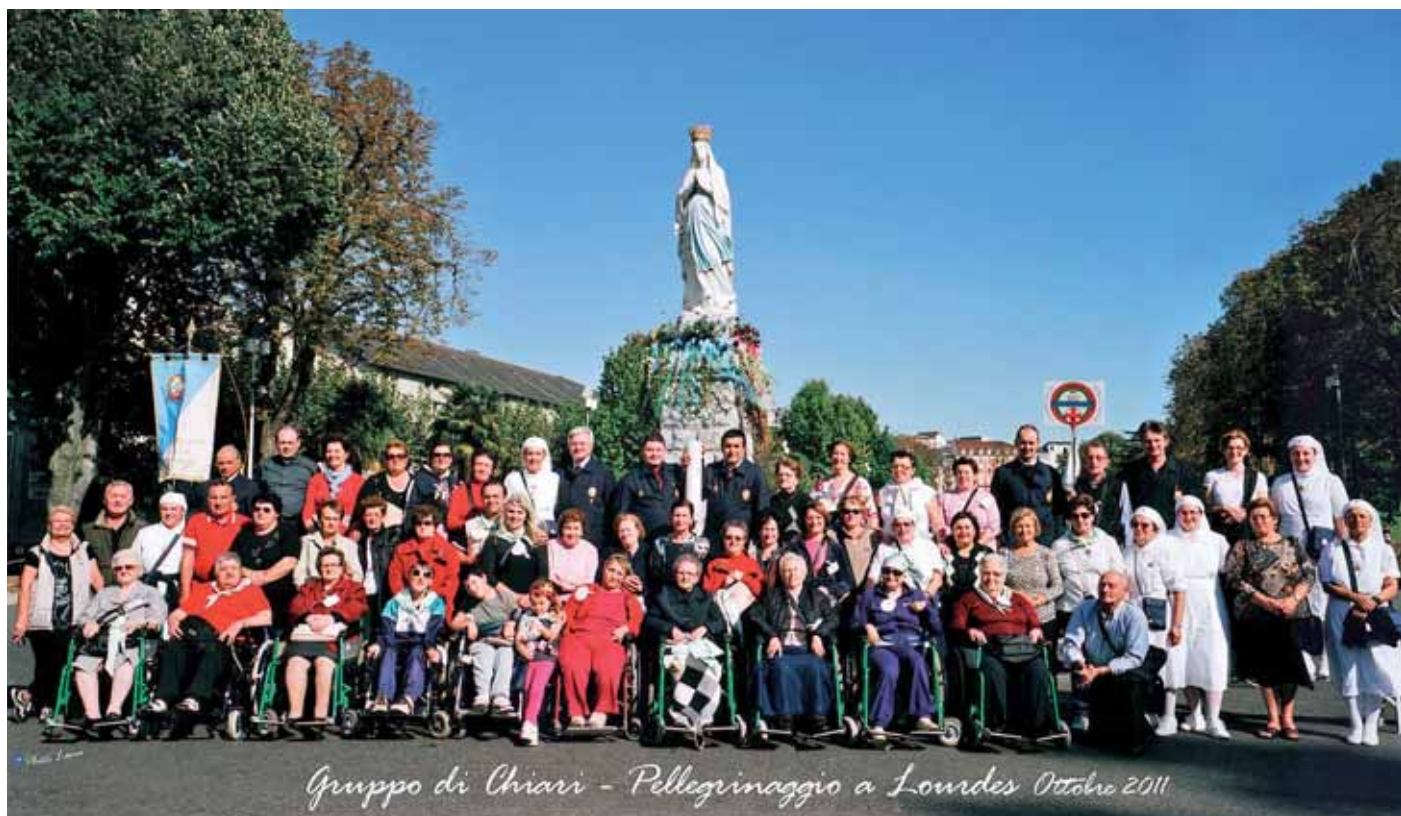
Gruppo di Chiari - Pellegrinaggio a Lourdes Ottobre 2011