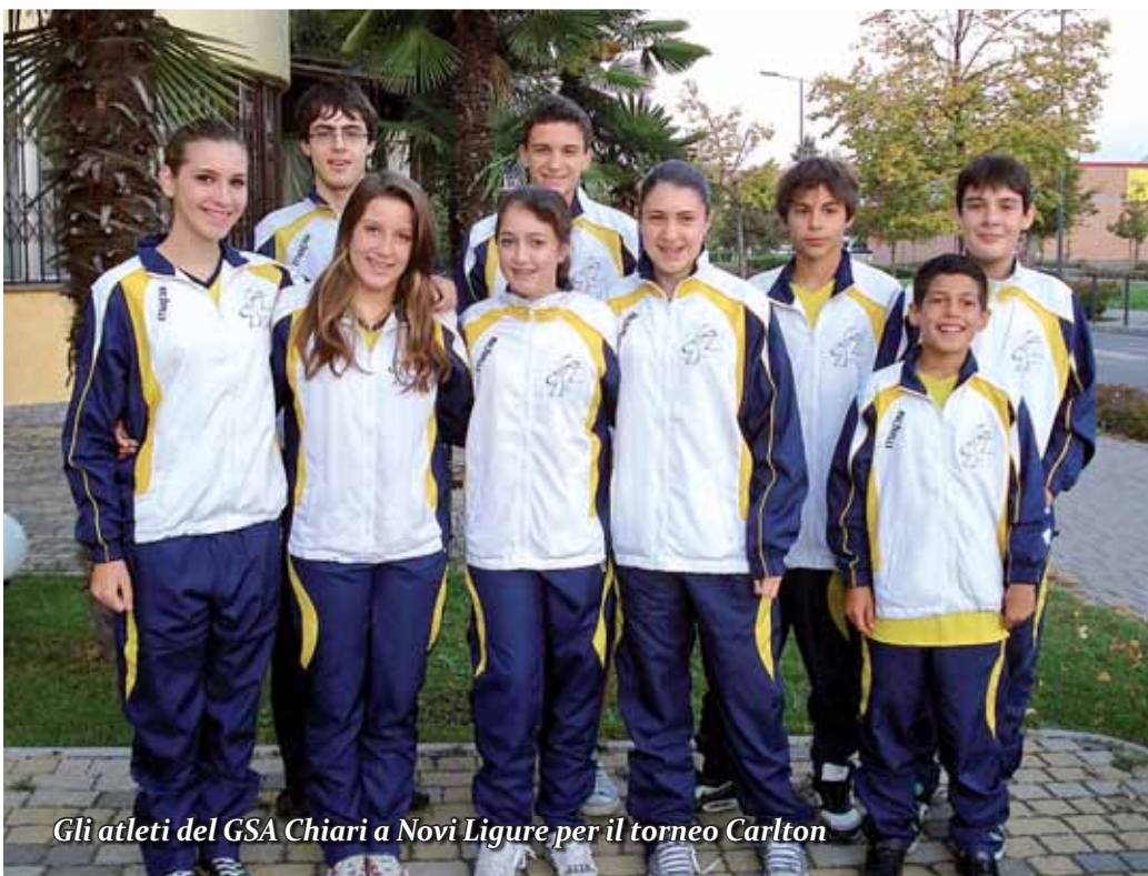
Gli atleti del GSA Chiari a Novi Ligure per il torneo Carlton

Il campionato di pallavolo di serie C è appena iniziato. La partenza dell' AZ Chiari è stata negativa. La squadra è ampiamente rinnovata ed ogni giudizio è da rinviare. Alcune novità stanno riguardando gli impianti a disposizione degli sportivi clarensi. □