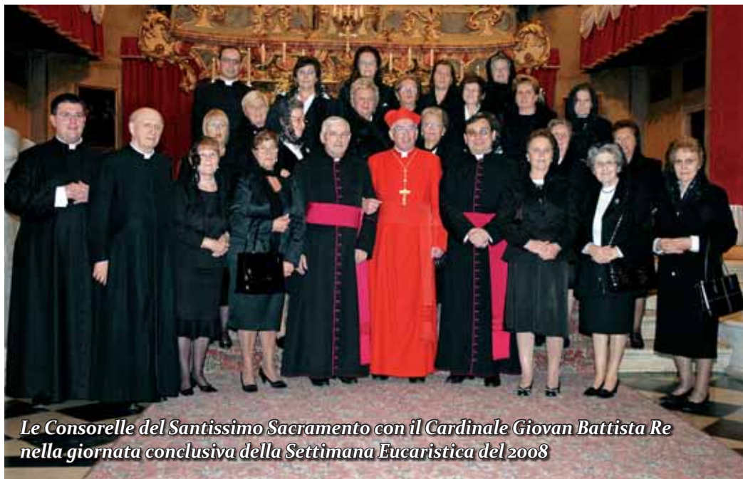
Le Consorelle del Santissimo Sacramento con il Cardinale Giovan Battista Re nella giornata conclusiva della Settimana Eucaristica del 2008

(corrispondono all'incirca a 2.000 euro d'oggi!) e la stessa quota andava versata ogni anno. «Ogni Consorella sarà assidua alla Messa con la Comunione e farà di frequente la visita al Santissimo Sacramento. Non tralascierà in alcun modo questi impegni nelle solennità liturgiche. Sarà dovere di ciascuna Consorella nutrire una tenera devozione al SS. Sacramento e al Sacro Cuore di Gesù,