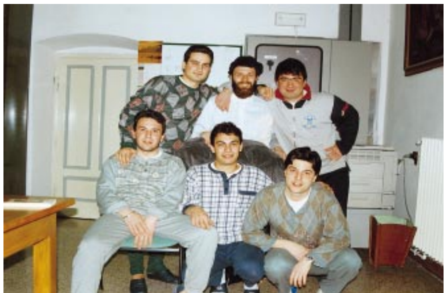
Gli obiettori di coscienza in servizio a San Bernardino.

Servire il proprio paese è una tappa fondamentale della vita di ogni individuo, un periodo durante il quale ognuno è chiamato a vivere fianco a fianco con altre persone, facendo esperienze nuove che contribuiscono alla formazione della sua coscienza civica a prescindere dal fatto che egli abbia preferito la "naia" (spesso abbastanza dura) o una sua altrettanto dignitosa alternativa (che sa essere difficile in eguale misura). Purtroppo il legislatore sembra orientato verso la scelta di un servizio di leva fatto da soldati professionisti, decretando di fatto la scomparsa dell'obbligo e, se ormai tutti siamo d'accordo che è necessaria una riforma del nostro esercito, sarebbe forse più sensato e formativo, alla luce di quanto detto, chiedere a tutti gli altri di prestare co-