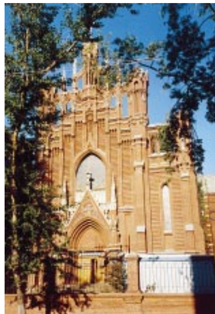
Mosca, Chiesa dell'Immacolata Concezione affidata ai Salesiani. Per ora è usufruibile solo la parte inferiore.