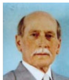
Dante Sirani 16/11/1930 - 7/1/1999