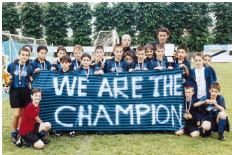
«Noi siamo campioni», dice la scritta

In terza categoria il Rustico Belfiore è chiamato a confermare il buono